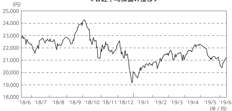
&lt;日経平均株価の推移&gt;

2019年1月以降は、FRB（米連邦準備制度理事会）議長が柔軟な金融政策運営方針を示したことで、今後の金融引き締めへの懸念が薄らいだことなどから米国株式市場が上昇したことなどを受け、国内株式市場は上昇しましたが、5月以降は、再度米中貿易摩擦への懸念が高まったことなどから下落しました。