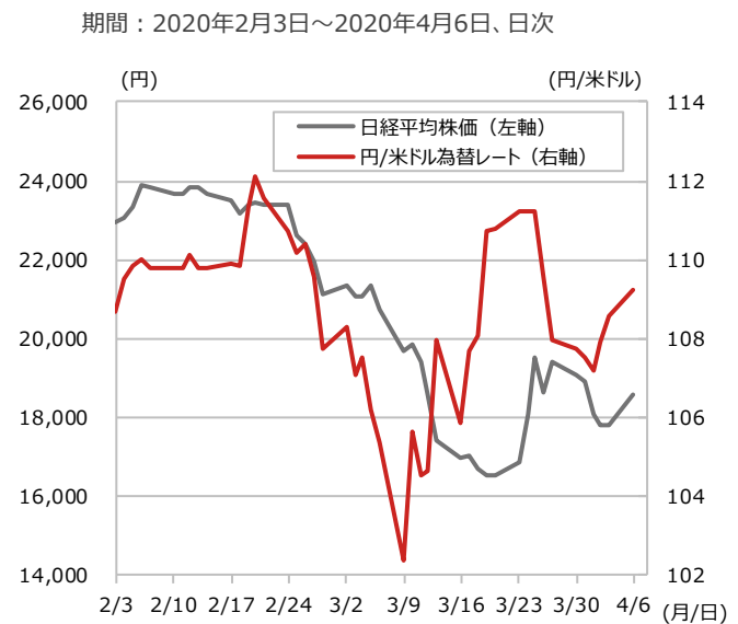
図2：日本の株式市場と円/米ドル為替レート