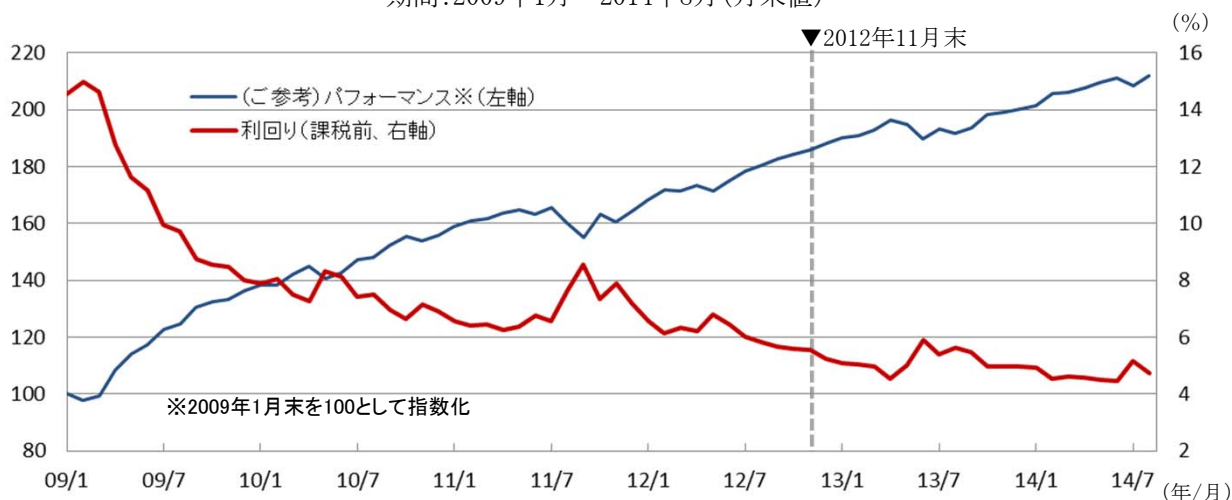
米国ハイ・イールド債(BB～B格):BofA・メルリンチ・US ハイ・イールド・キャッシュ・ペイ・BB-B レイティド・コンストレインド・インデックス (出所)ブルームバーグのデータに基づき野村アセットマネジメント作成