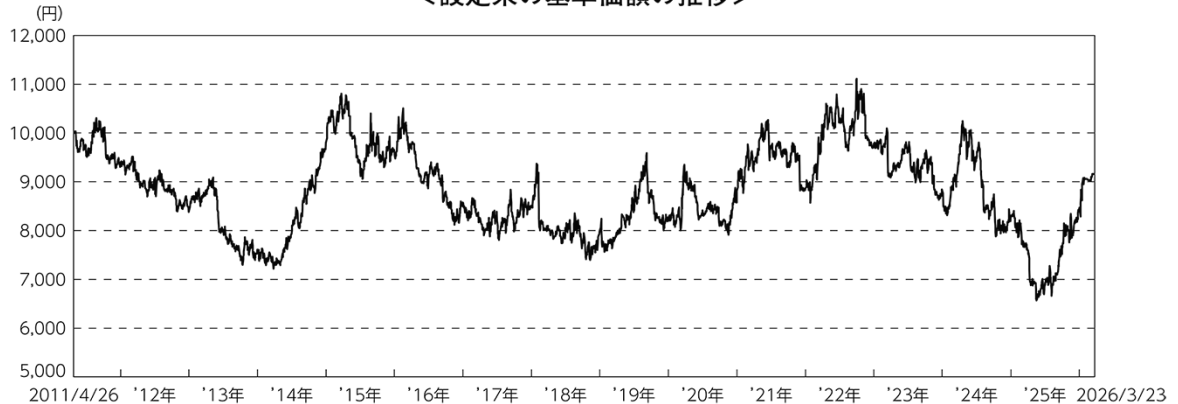
＜設定来の基準価額の推移＞