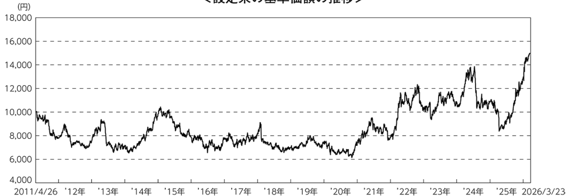
<設定来の基準価額の推移>