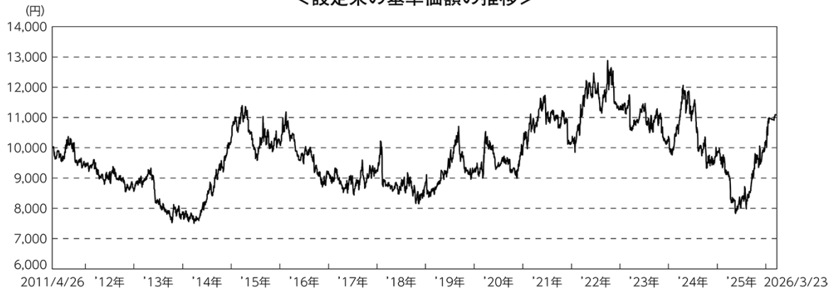
<設定来の基準価額の推移>