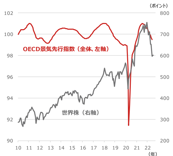
OECD景気先行指数と世界株

期間：（OECD景気先行指数）2010年1月～2022年6月、月次 （世界株）2010年1月末～2022年7月11日、月次 ・世界株はMSCI All Country World Index、米ドルベース