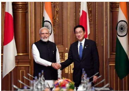
2022年5月 モディ首相と岸田総理