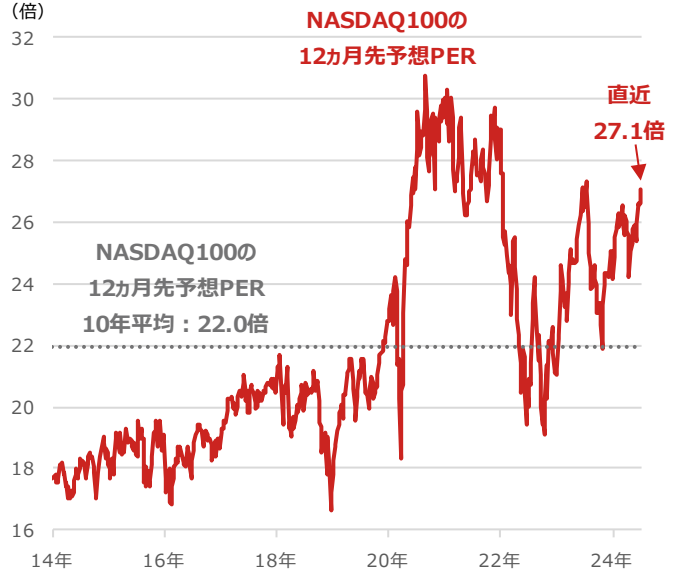
NASDAQ100の12ヵ月先予想PER（株価収益率）と同10年平均

期間：2014年1月3日～2024年7月3日、週次 （出所）Bloombergより野村アセットマネジメント作成