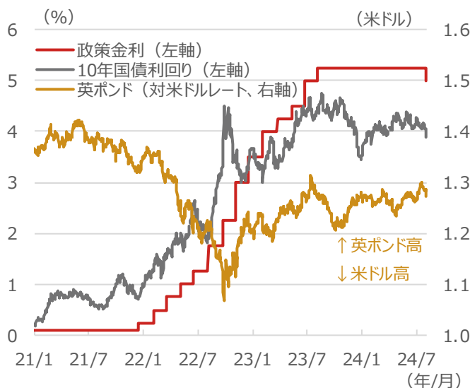
英国の政策金利、10年国債利回り、英ポンド（対米ドルレート）

期間：2021年1月1日～2024年8月1日、日次 (出所) Bloombergより野村アセットマネジメント作成