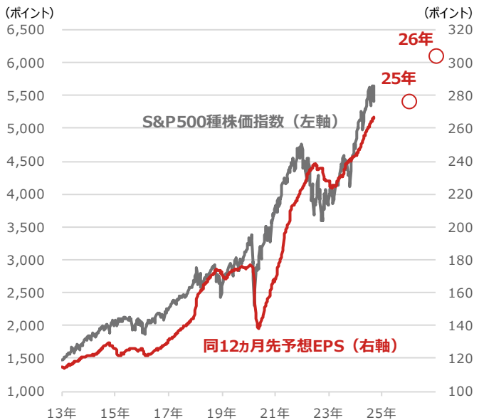
期間：2013年1月4日～2024年9月18日、週次 ●印は2025年、2026年のBloomberg予想（2024年9月18日時点） （出所）Bloombergより野村アセットマネジメント作成

*当資料は、一部個人の見解を含み、会社としての統一の見解ではないものもあります。