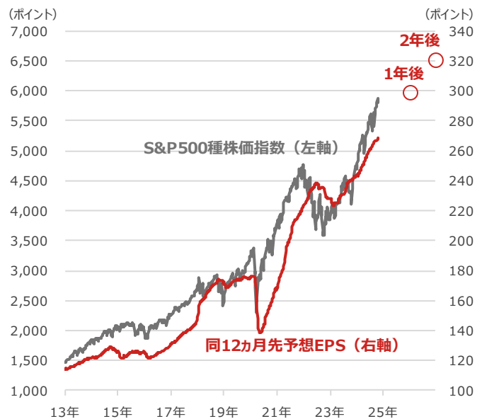
S&P500種株価指数と 同12ヵ月先予想EPS（1株当たり利益）

期間：2013年1月4日～2024年10月30日、週次 ・○印は1年後、2年後の12ヵ月先予想EPS（2024年10月30日時点）