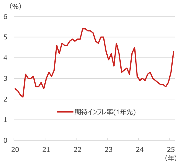
1年先期待インフレ率（米ミシガン大学調査）

期間：2020年1月～2025年2月、月次