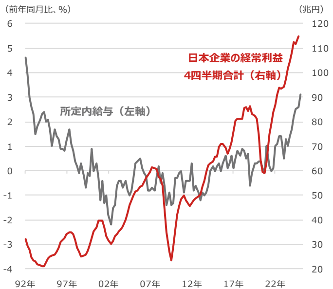
日本企業の経常利益4四半期合計と所定内給与

期間：（日本企業の経常利益）1992年1-3月期～2024年10-12月期、四半期 （所定内給与）1992年3月～2025年1月、四半期 ・日本企業の経常利益は法人企業統計のデータを用いた