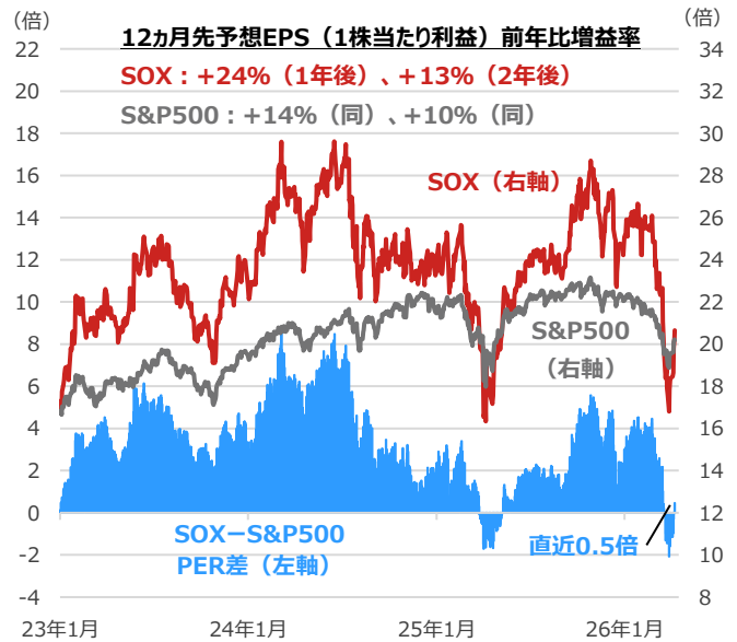
SOX（フィラデルフィア半導体株指数）とS&P500の12か月先予想PER（株価収益率）とその差

期間：2023年1月3日～2026年4月10日、日次 ・1年後、2年後の12か月先予想EPSは2026年4月10日時点のBloomberg予想 ・12か月先予想PER差の直近0.5倍は2026年4月10日時点の値