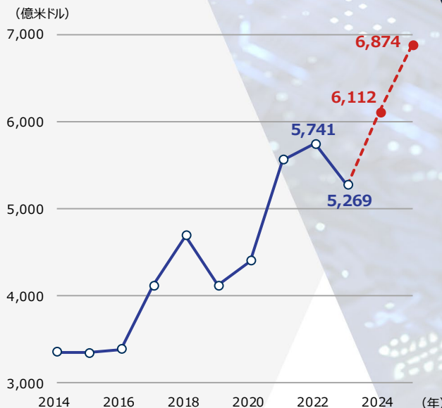
世界の半導体出荷額の推移

期間：2014年～2025年、年次 2024年以降はWSTSの予想（2024年6月時点）