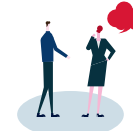
コーポレートガバナンス