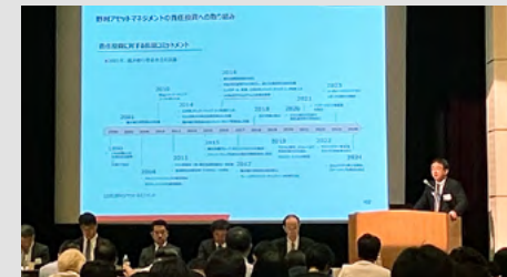
東証・JPX共催セミナー

本セミナーは、機関投資家との対話機会が少ない上場会社のIR実務担当者を中心にご参加を頂き、機関投資家である当社より、機関投資家の投資スタンスや運用方針、上場会社のIR活動に対して求めている情報などについて「リサーチ」・「運用」・「責任投資」の3つの領域から計6名が講師として登壇し、ご説明させて頂きました。